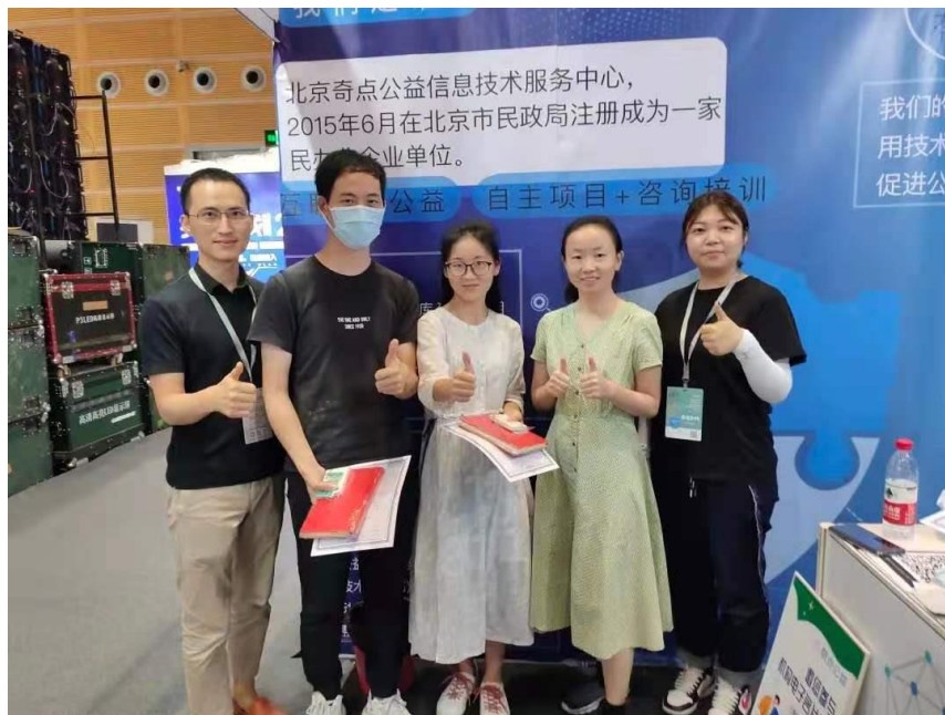
图十：奇点公益工作人员与现场劝募志愿者合影

在确定项目众筹目标、计划之后，奇点公益围绕计划招募志愿者，完成一系列众筹工作，并与 99 公益日期间发起线上劝募等活动。