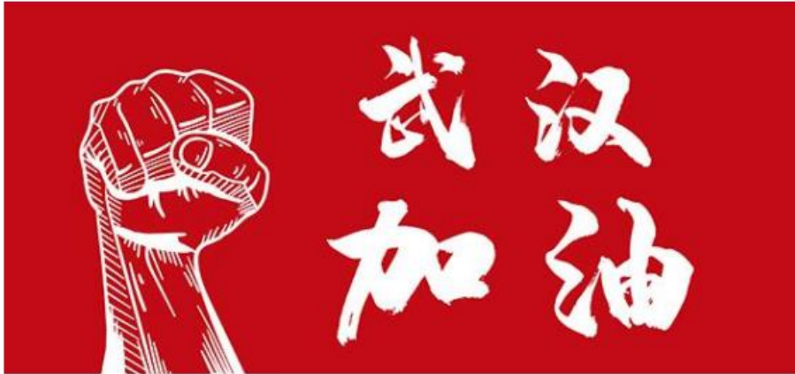
图二：2019-NCP 全国机构行动数据库截图

数据集简介：本次搜集整理的所有数据为奇点抗肺炎行动小组搜集，旨在搜集大型企业、公益机构在抗击疫情中的行动和贡献，甄选出为公众有实用价值的疫情支持信息。