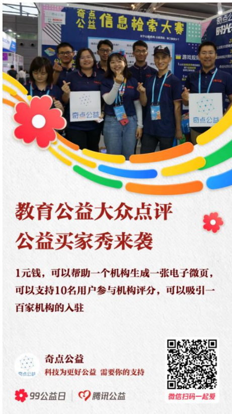
图九：教育公益大众点评 99 活动海报

我们将在此基础上筹集资金支持，去完善我们的公益数据以及小程序功能开发，并在 2021 年进行全方面的项目运营推广，激活公众参与、公益机构使用，在 2022 年 9 月，预计完成 1000 人次在小程序参与点评服务，从而得到较为科学全面的教育公益榜单。