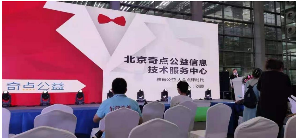
图八：奇点公益第八届深圳慈善展参加项目路演