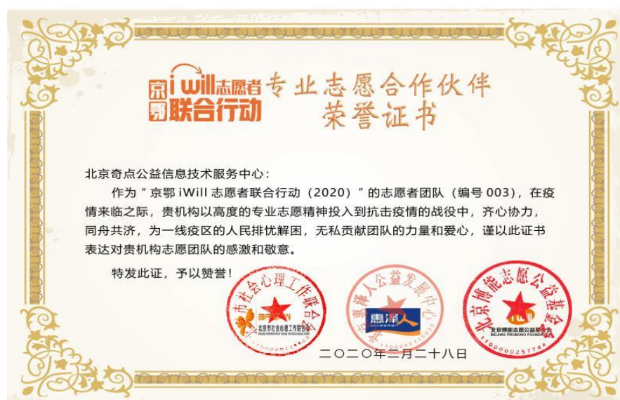
图六：奇点公益在 i Will 志愿联合行动中被授予专业合作伙伴