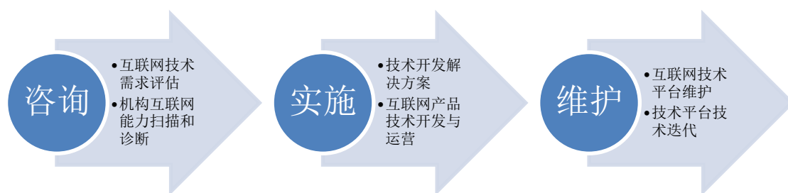
图十一：互联网公益项目咨询服务模型

2020年基于多年的互联网公益经验，我们为多家基金会提供了技术解决方案，涉及基金会信息化建设方案、技术咨询和评估、技术方案及开发和运营服务。